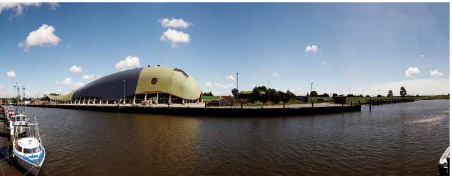
Panorama des Friedrichskooger Hafens, der zum Erlebnishafen ausgebaut werden soll.

Die vordere Halle ist großzügig verglast und gewährleistet einen optimalen Tageslichteinfall. Durch den Schwanz des „Meeresgiganten“ gelangt man in das Innere, wo ein vielfältiges und vor allem wetterunabhängiges Angebot an Aktivitäten und Spielmöglichkeiten auf Groß und Klein wartet. Durch das riesige Walmaul gelangen die Besucher in die Außenbereiche des Spielparks.