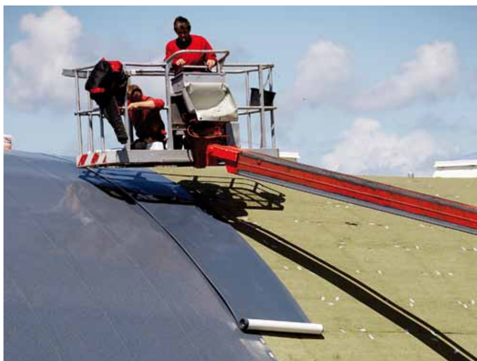
Eine polyestervlieskaschierte Kunststoff-Dichtungsbahn bildet die schützende und belastbare Außenhaut des Wals.

Auf die Dämmung wurde anschließend eine thermisch und mechanisch hoch beanspruchbare, polyestervlieskaschierte Kunststoff- Dachabdichtungsbahn verlegt. Die einzelnen Abdichtungsbahnen wurden im Überlappungs- bereich zusammen mit der Dämmung mecha- nisch befestigt und abschließend mit einem Kaltquellkleber bzw. mit Heißluft verschweißt. Gut 3.000 Quadratmeter Dachfläche hat Karsten Poppner mit seinen Mitarbeitern dämmen und abdichten können. Ende Oktober 2008 – und damit genau zur richtigen, weil wetterunbeständigen Zeit – öffnete der Wal seine Tore und lässt seitdem die Kinderherzen höher schlagen, ganz gleich bei welchen Witterungsbedingungen.