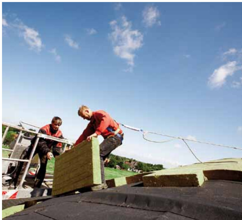
Die Dachform und auffrischende Nordseewinde erforderten teilweise die zusätzliche Leinen- absicherung der Dachdecker.